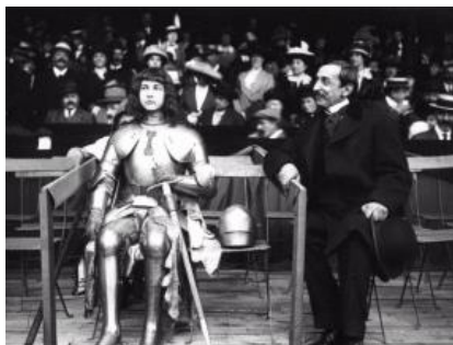
18 juin 1913, Compiègne, fêtes de Jeanne d'Arc, Maurice Barrès et une jeune fille déguisée en Jeanne d'Arc.

L'intérêt que Maurice Barrès porte à Jeanne d'Arc, à partir des années 1900, est lié à son retour à la Lorraine. Il construit un personnage qui est appelé à devenir un élément de sa Lorraine mythique. La « bonne Lorraine » le fascine parce qu'elle est mystérieuse, mais il la met aussi au service de son idéologie nationale ; elle lui permet de donner une transcendance à son patriotisme. Les « Cahiers » de Barrès montrent que Jeanne d'Arc est une des figures de l'histoire qui l'ont le plus obsédé ; aussi s'est-il engagé, dans le cadre de la Ligue des patriotes et à la Chambre, en faveur d'une Fête nationale de Jeanne d'Arc. Le rôle joué durant la Grande Guerre par le culte de l'héroïne, de la « libératrice de la France », a joué à cet égard un rôle déterminant.