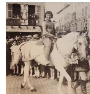
Jeanne d'Arc place des Vosges à Épinal Cortège des images de 1938

Jeanne, l'héroïne vosgienne est très fervente au cœur des spinaliens, elle est à la fois fêtée religieusement et civilement. . En 1906, une statue en bronze est érigée au centre de l'ancienne place de grève qui est rebaptisée à son nom. Lors de grandes fêtes populaires Jeanne est présente et défile dans les rues de la ville comme dans la « cavalcade historique de 1881 » ou encore en 1937 lors du «Cortège des images ». les fêtes religieuses sont nombreuses comme le V e centenaire de l'épopée de Jeanne d'Arc célébrée en grande pompe le 12 mai 1929. On lui érigea des statues dans les églises et sur des bâtiments publics, on donnera son nom aussi bien à une école libre, une société de gymnastique, une société d'épicerie en gros. Elle donne son nom à divers organismes encore aujourd'hui.