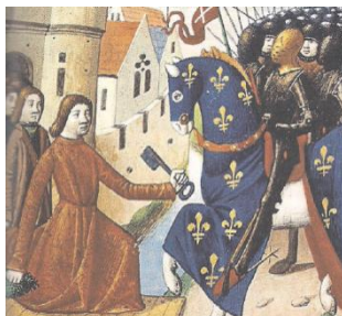
Miniature extraite des Vigiles de Charles VII , XV e siècle, BNF, Paris.

Depuis 2008, une nouvelle rédaction des programmes d'histoire au collège et au lycée a été entreprise. Les médias ont à plusieurs reprises évoqué leur contenu, en dénonçant un enseignement, qui laisse peu de place aux personnages historiques (Louis XIV, Napoléon....). Qu'en est-il pour Jeanne d'Arc ? Une lecture précise et critique des programmes et un inventaire des pratiques pédagogiques permettent d'apprécier la place réservée à cette héroïne dans l'enseignement actuel, mais aussi d'expliquer comment on envisage aujourd'hui d'aborder un personnage historique avec les élèves.