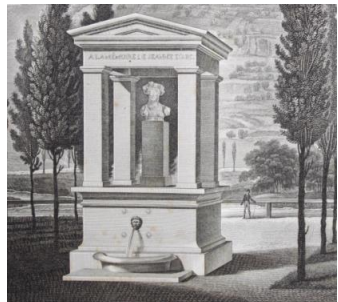
Monument à la gloire de Jeanne d'Arc conçu par Prosper Jollois et dessiné par Charles Pensée, inauguré le 10 septembre 1820 à Domremy.